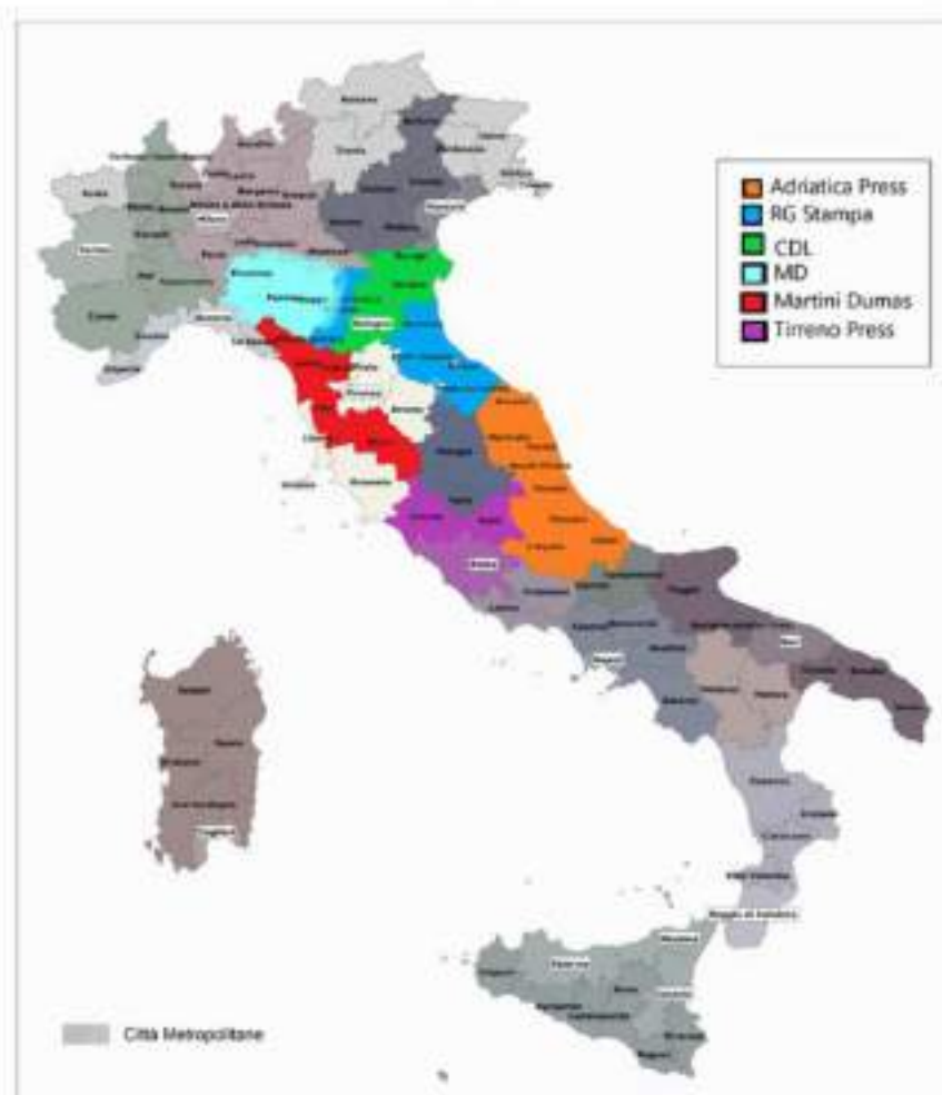
Figura 3 - Aree di attività dei distributori locali controllati da Artoni Group e SRH

52. Nelle relative aree di attività, i distributori locali controllati da Artoni Group e SRH si trovano in una posizione di monopolio, vale a dire che curano la distribuzione alle rivendite di tutte le pubblicazioni mentre non vi sono altri distributori locali che gestiscano i mandati di altri distributori nazionali o editori. Fanno eccezione solo le province del Lazio (dove è attivo Tirreno Press), nelle quali alcuni distributori nazionali, tra cui in particolare M-Dis, affidano i mandati a distributori locali diversi da Tirreno Press. Ad ogni modo, nelle province in questione, Artoni Group detiene quote di