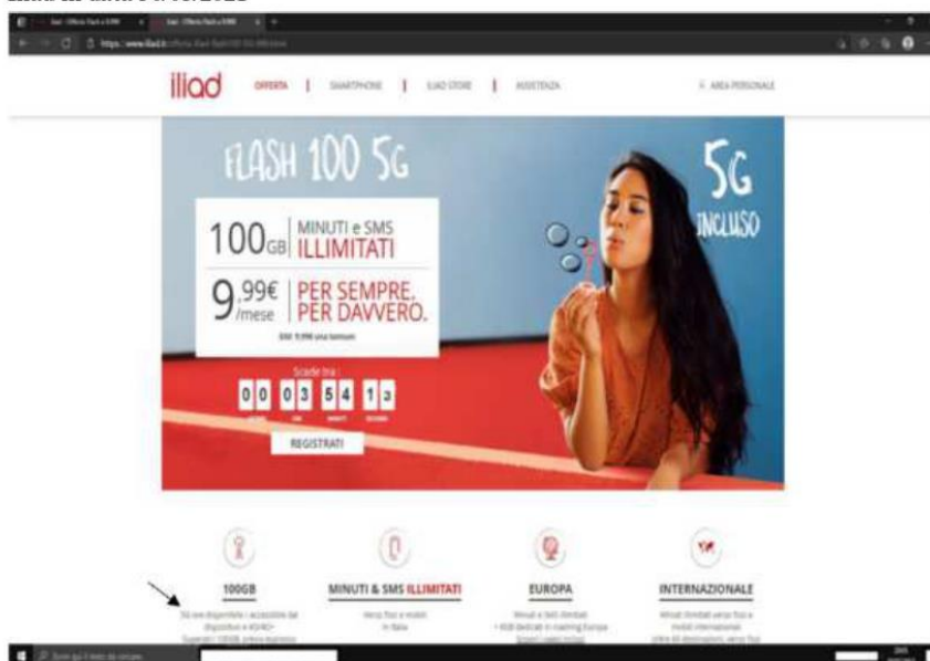
Figura 3 – Comunicazione commerciale relativa all’Offerta “Flash 100 5G” presente sul sito Iliad in data 30/03/2021

26. Solo alla fine della pagina è riportato il link “scopri i dispositivi compatibili e la copertura” , che consente di avere informazioni di maggiore dettaglio sulla copertura territoriale della rete 5G di Iliad e sui dispositivi compatibili con tale specifica rete dell’operatore, ma che è raggiungibile solo attraverso numerosi scroll dello schermo, dopo la sezione che enfatizza le prestazioni del 5G e la sezione relativa alla parte “Internazionale” dell’offerta 31 .