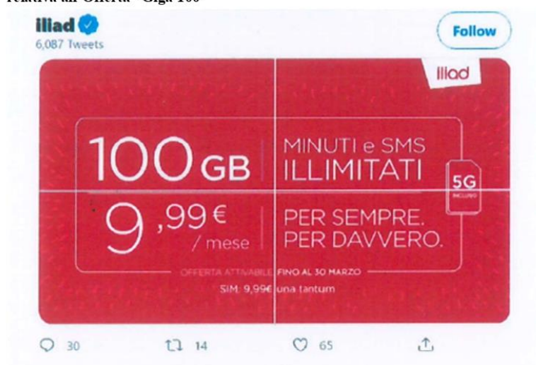
Figura 2 - Comunicazione commerciale presente sul profilo Twitter di Iliad in data 02/03/2021 relativa all'Offerta "Giga 100"

23. Con riferimento alla pubblicità delle suddette offerte promossa attraverso altri canali pubblicitari, quali pagine del sito web di Iliad, spot televisivi, cartellonistica stradale, simbox , volantini, e-mail e SMS, sono state utilizzate, invece, locuzioni decettive che non fanno specifico riferimento alla rete 5G dell'operatore.