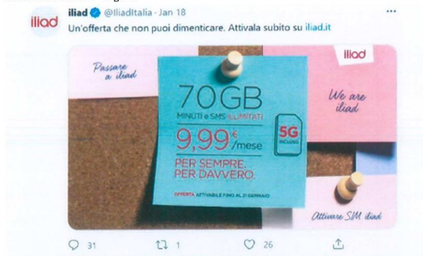
Figura 1 - Comunicazione commerciale presente sul profilo Twitter di Iliad in data 18/01/2021 relativa all’Offerta “Giga 70”

22. Si vedano, a titolo esemplificativo, le seguenti immagini relative alle offerte “Giga 70” e “Giga 100” tratte dal profilo Twitter di Iliad: