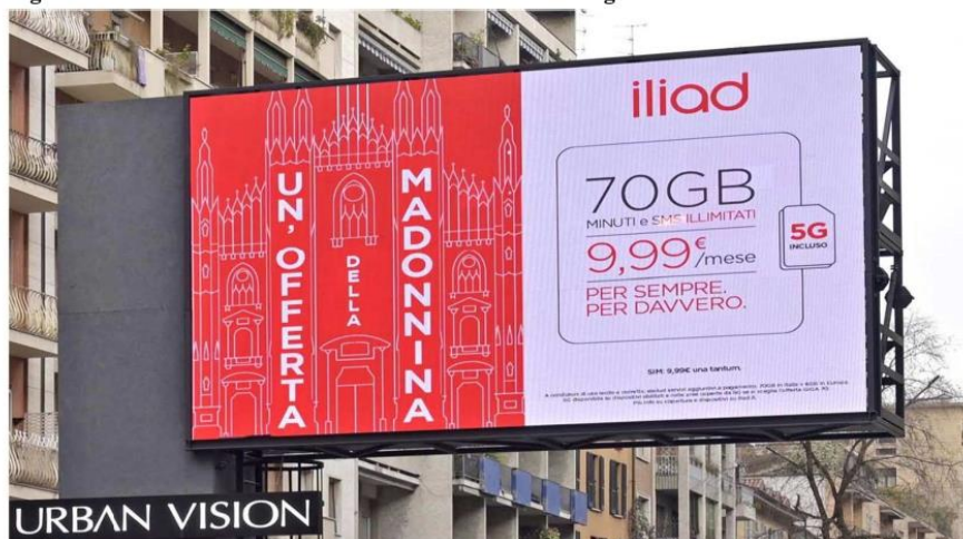
Figura 5 – Cartellonistica stradale relativa all’Offerta “Giga 70”

30. Il medesimo disclaimer risulta impiegato dal professionista anche per i volantini pubblicitari relativi alle suddette offerte presenti nei punti distributivi Iliad 35 .