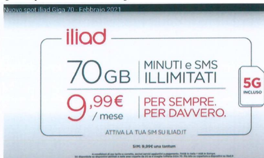
Figura 4 – Spot TV relativo all’Offerta “Giga 70”